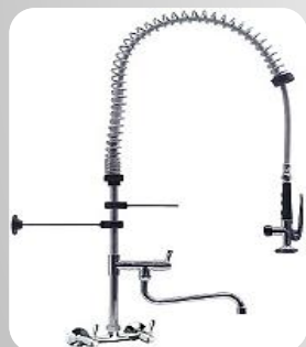
Douchette murale Bi-trou (Entraxe de 152mm)