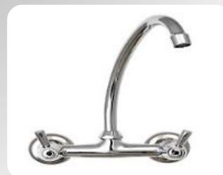
Robinet mural Bi-trou (Entraxe de 152mm)