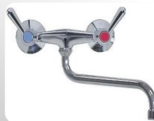
Robinet mural Bi-trou (Entraxe de 152mm)