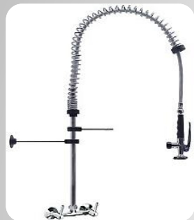
Douchette murale Bi-trou (Entraxe de 152mm)