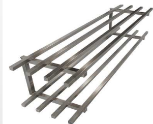
Etagère barreudée sur 2 niveaux

Ces étagères murales se déclinent dans toutes les dimensions « sur-mesure ». Ces modèles existent en 1 - 2 ou 3 niveaux identiques ou jumelés (plateau plein et/ou barreudé).