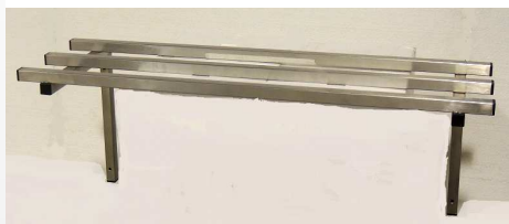
Etagère murale barreudée sur consoles fixes