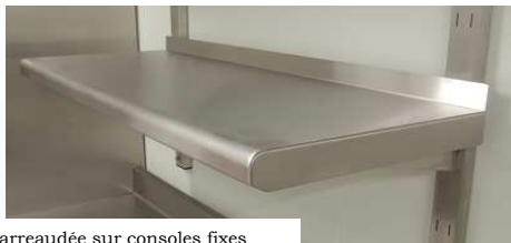
Etagère murale Amovible et réglable sur crémaillère