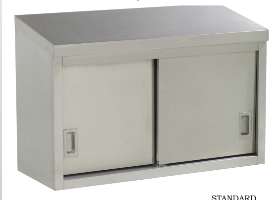
Placard mural à portes coulissantes