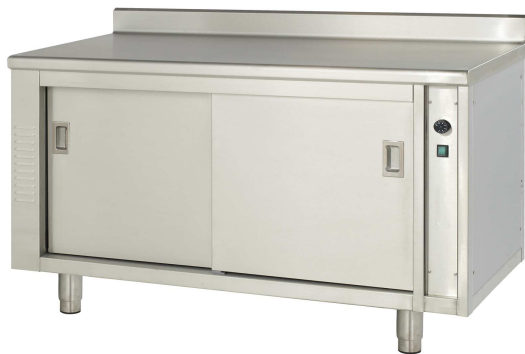
Meuble étuve à portes coulissantes adossé

Angles + dosseret rayonnés et polis / Dessus thermique et renforcé / Caisson calorifugé