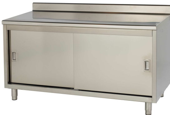
Meuble adossé à portes coulissantes

Angles + dosseret rayonnés et polis / Dessus insonorisé et renforcé / Parois doublées